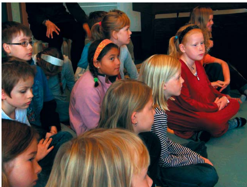
Tunnelmia esityksen jälkeen.