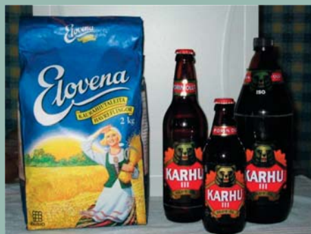
Kyse on tietenkin Kulttuurin ja kolme karhua -sadusta.